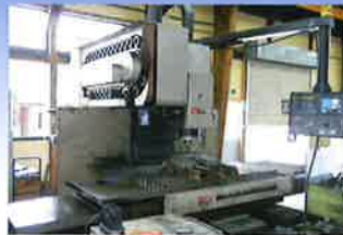
立型マシニングセンター