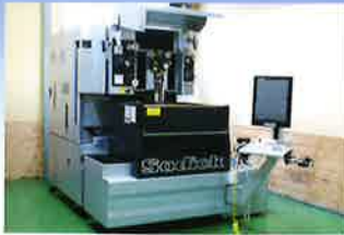
ワイヤーカット放電加工機