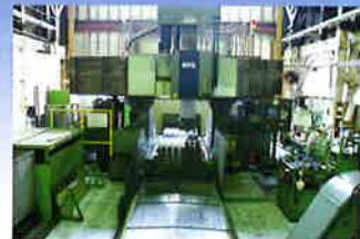
五面加工マシニングセンター